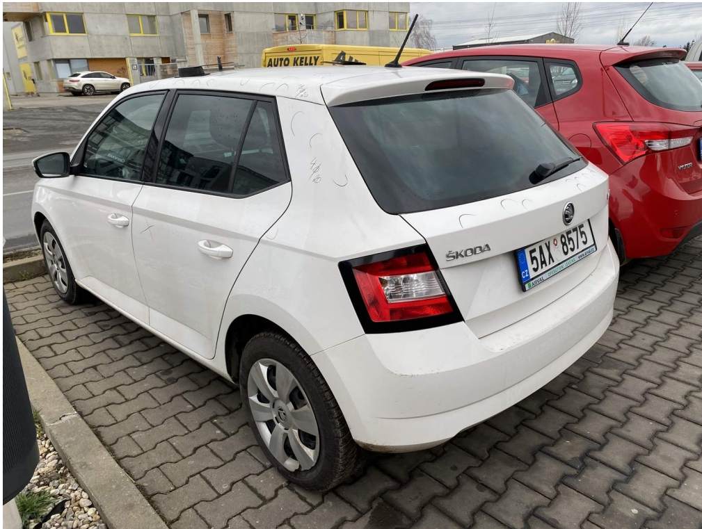
Viz popis k poškození č. 1