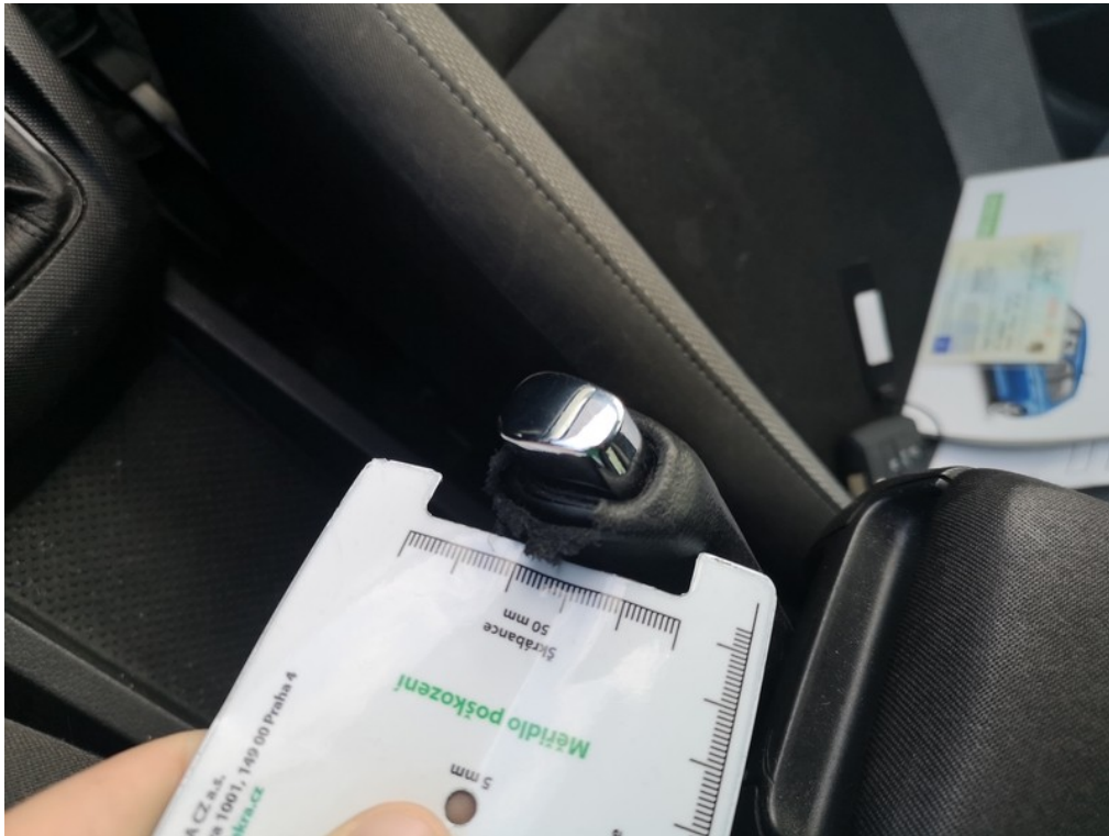
Viz popis k poškození č. 27