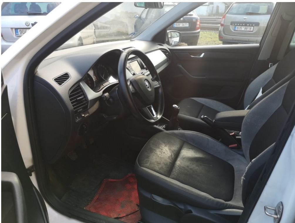
Interiér z levé strany