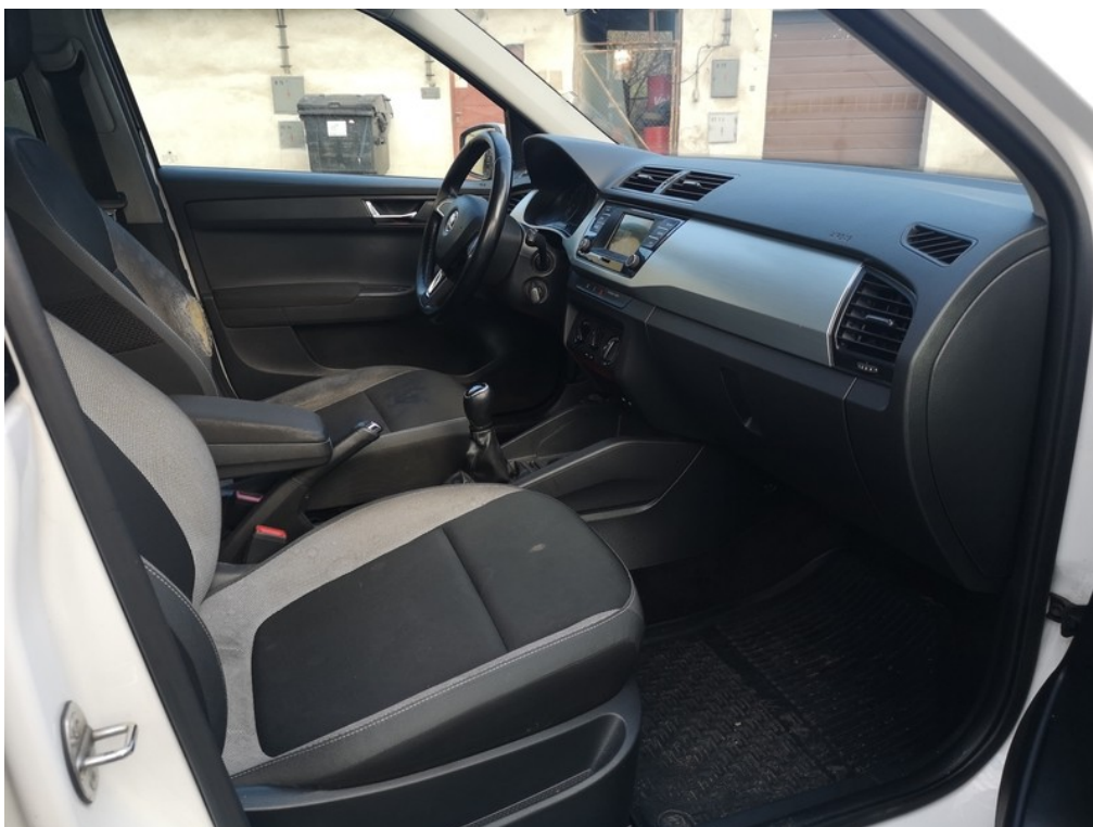
Interiér z pravé strany