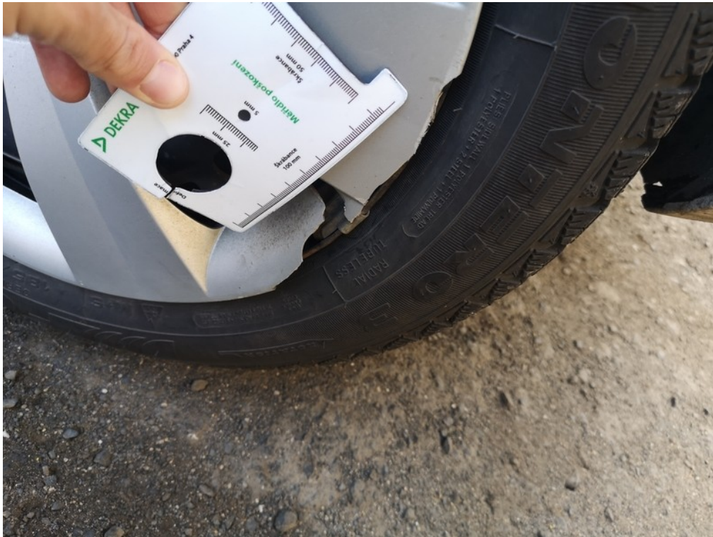
Viz popis k poškození č. 18