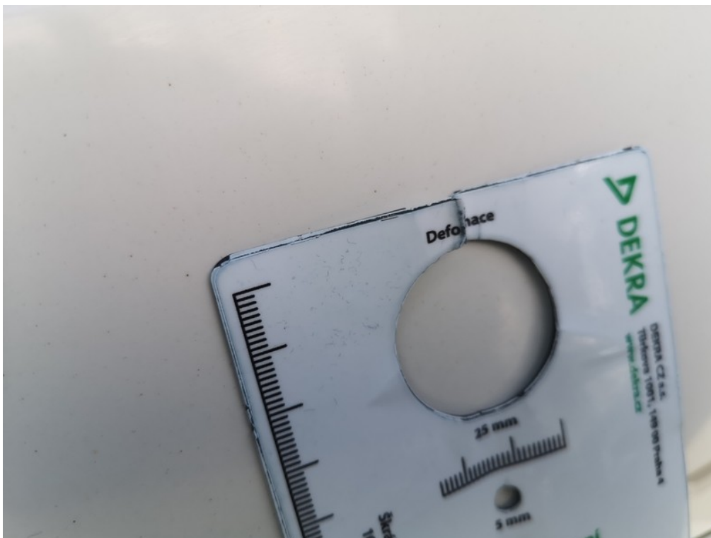
Viz popis k poškození č. 11