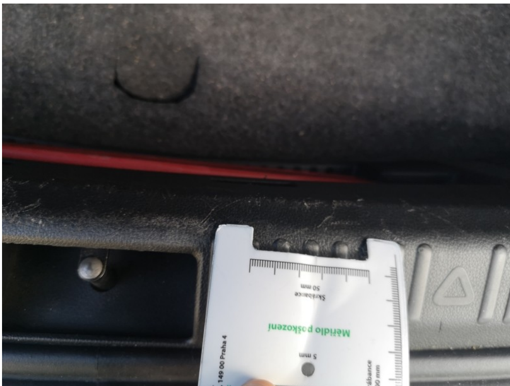
Viz popis k poškození č. 31