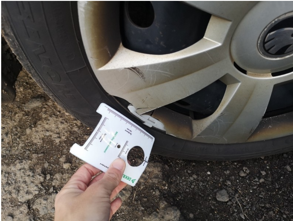
Viz popis k poškození č. 17