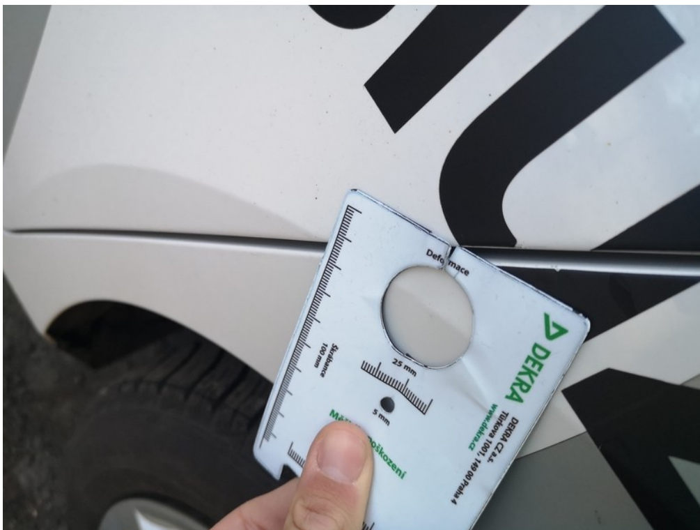
Viz popis k poškození č. 8