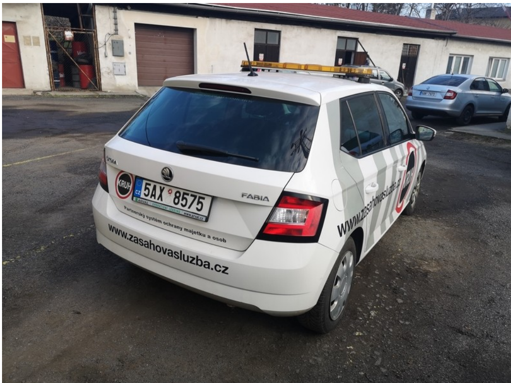
Pohled zezadu zprava