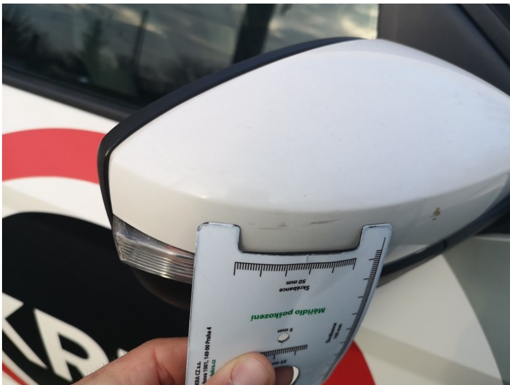
Viz popis k poškození č. 16