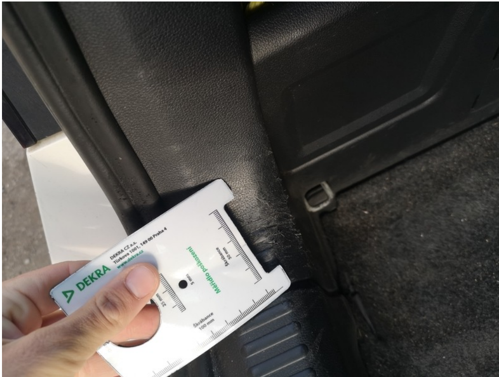
Viz popis k poškození č. 29