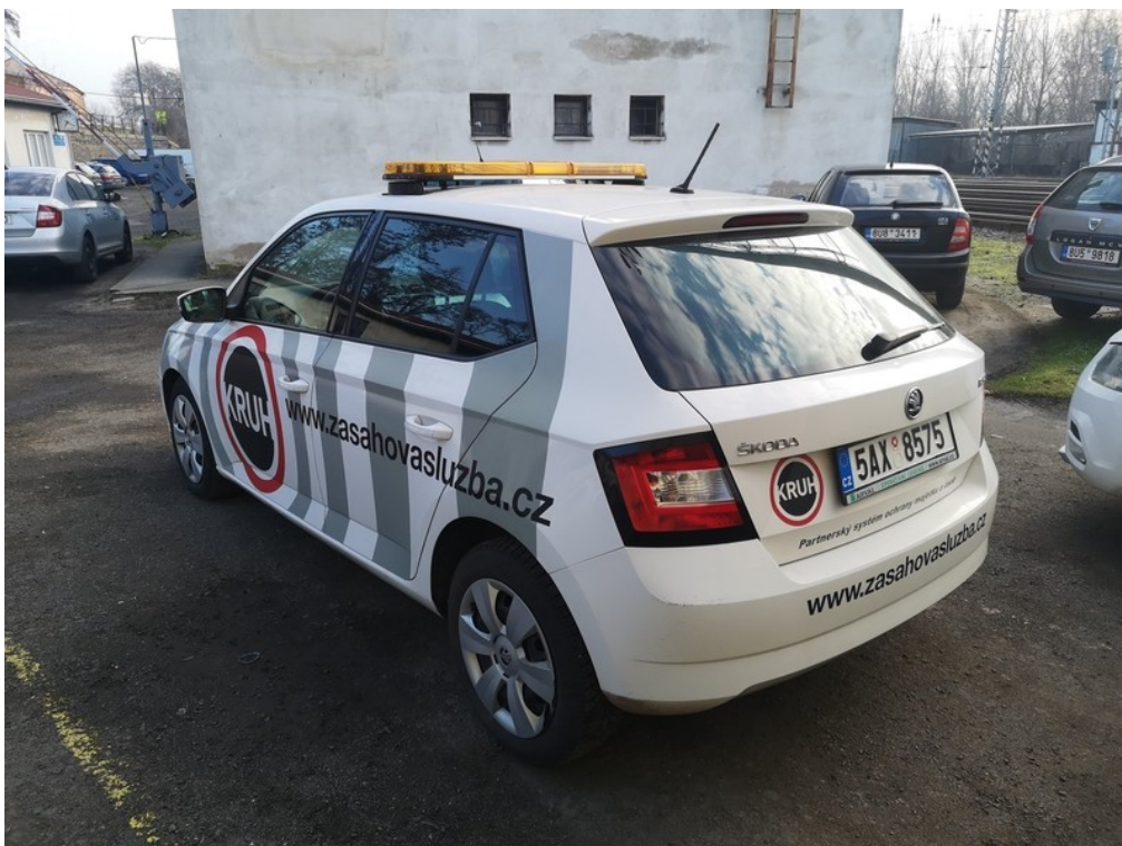
Pohled zezadu zleva