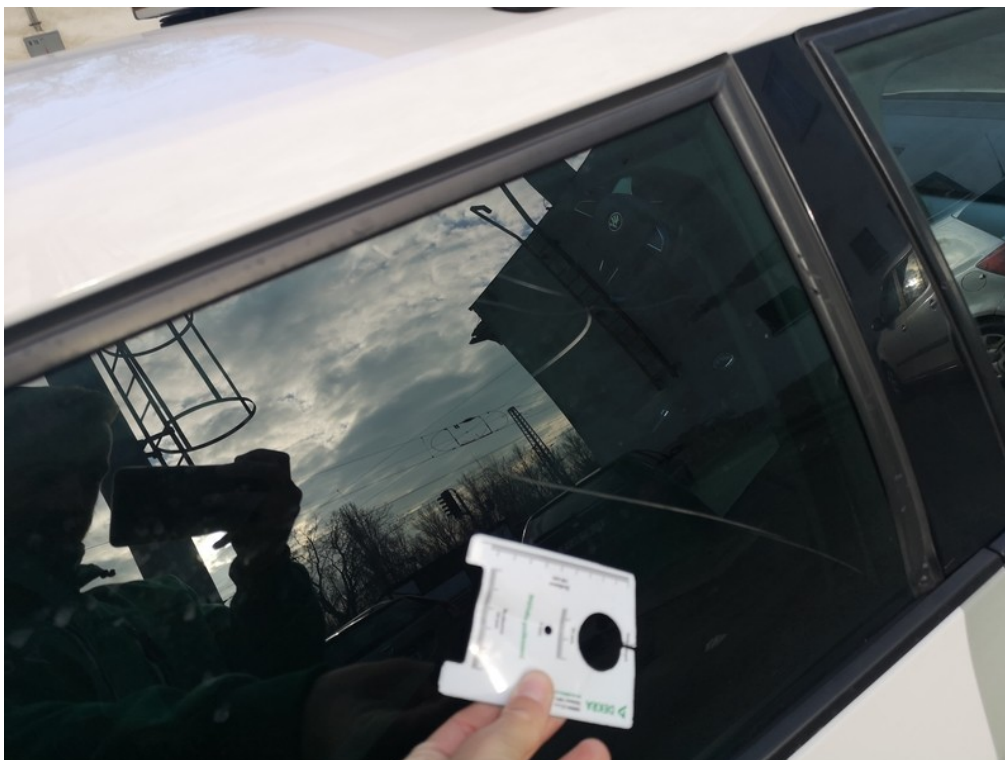
Viz popis k poškození č. 12