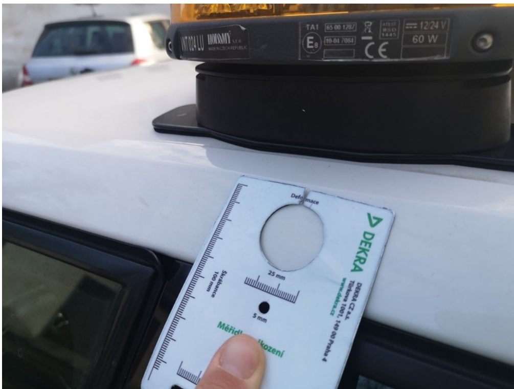
Viz popis k poškození č. 7