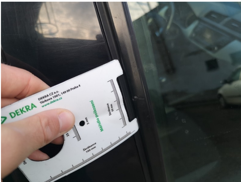
Viz popis k poškození č. 14