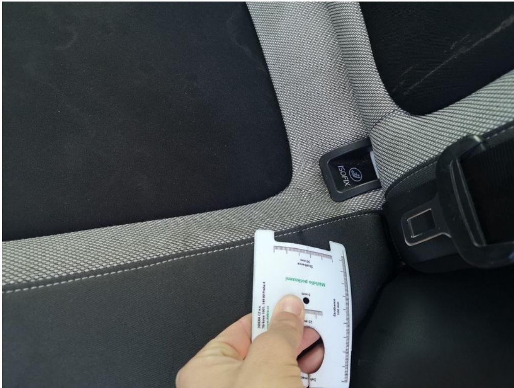
Viz popis k poškození č. 28