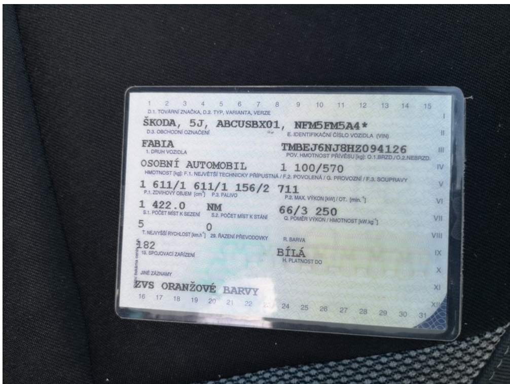
ORV č.l. str.2