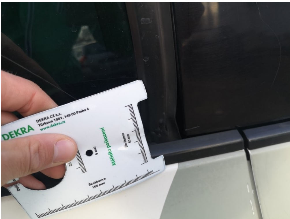
Viz popis k poškození č. 13