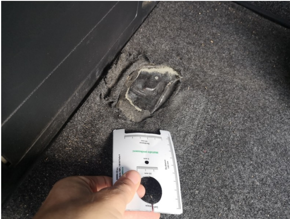
Viz popis k poškození č. 32