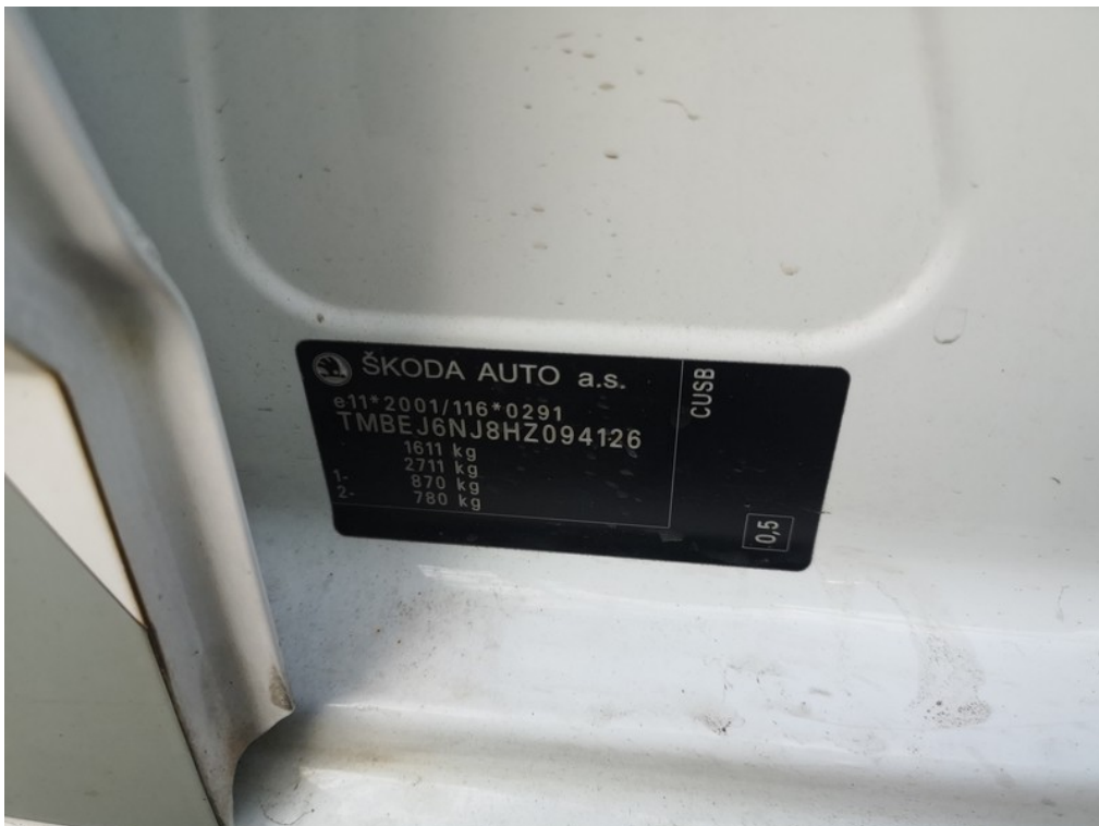
VIN / výrobní štítek