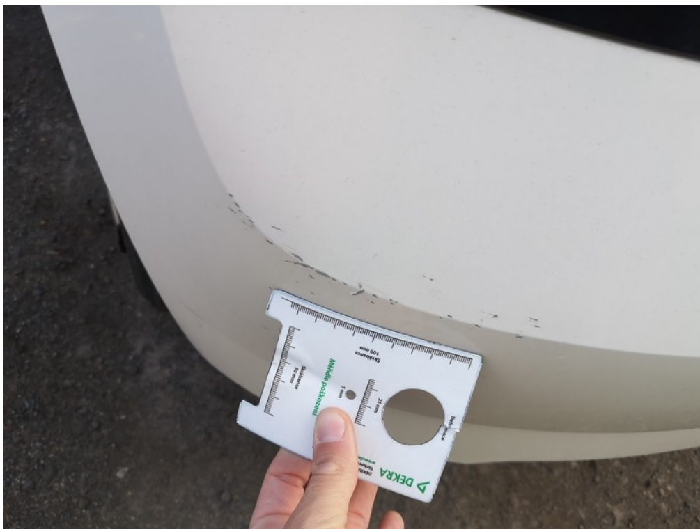
Viz popis k poškození č. 9