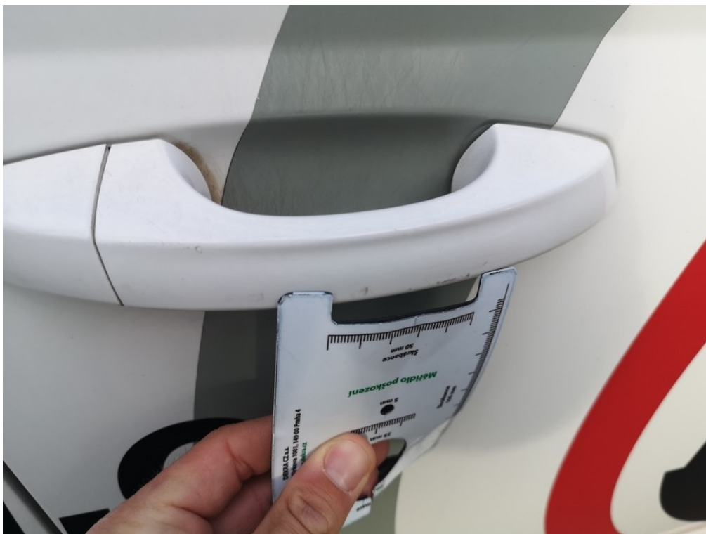
Viz popis k poškození č. 15