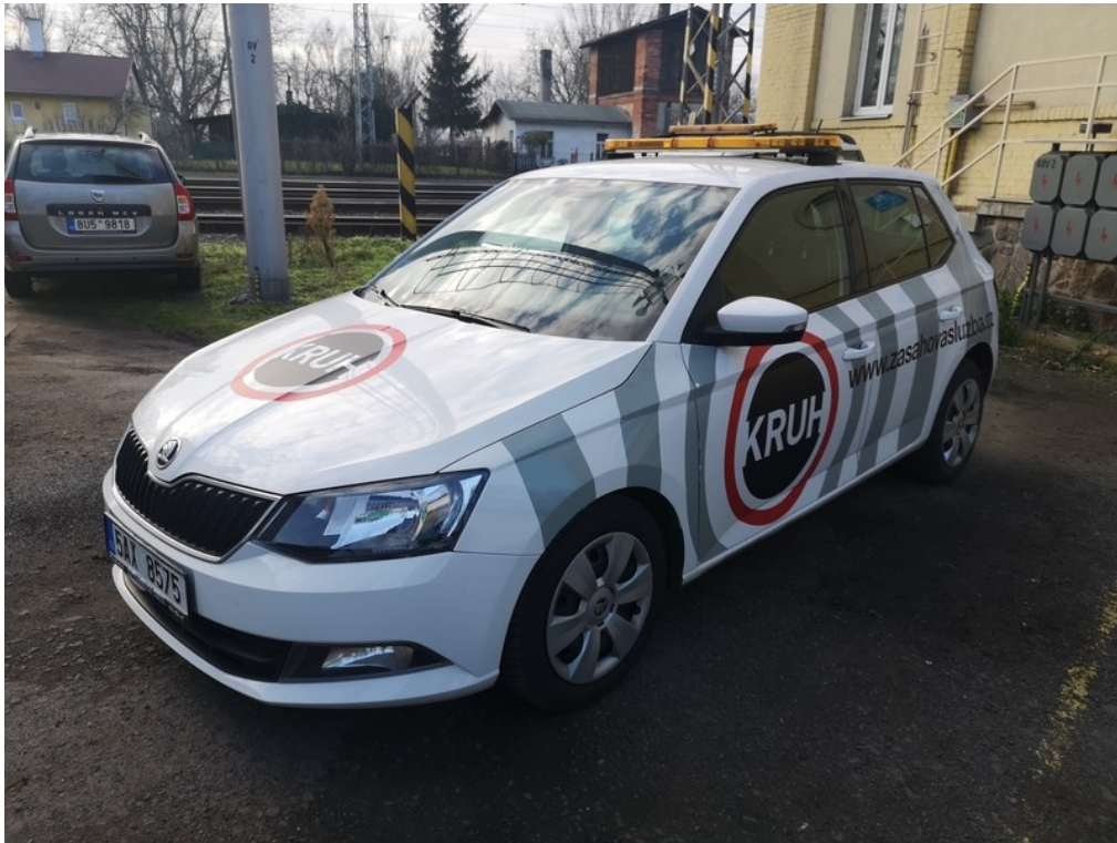
Pohled zepředu zleva