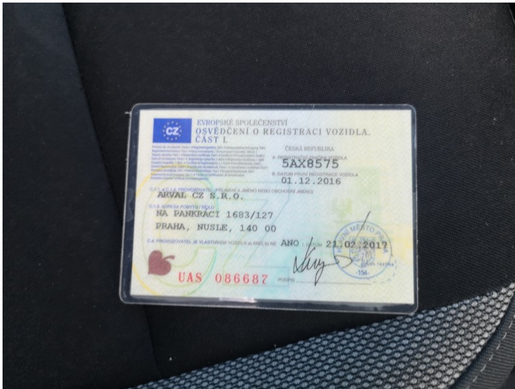
ORV č.l. str.1