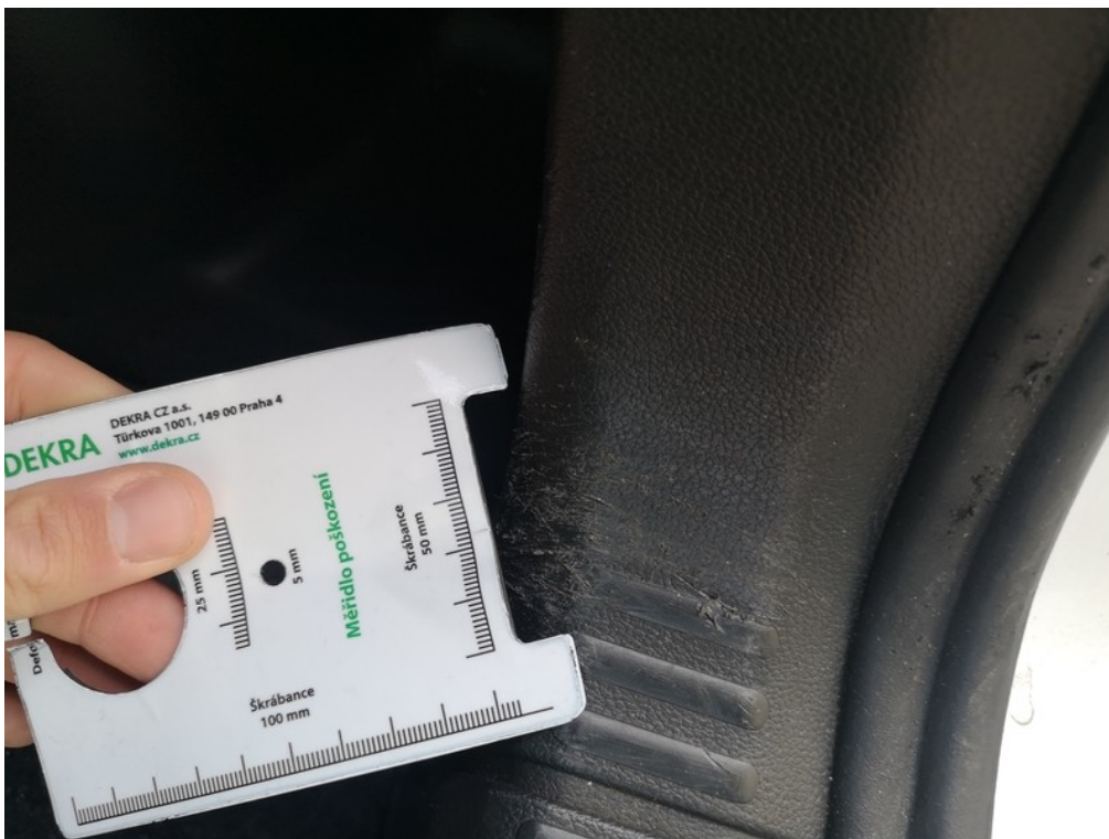
Viz popis k poškození č. 30