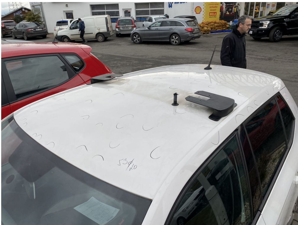
Viz popis k poškození č. 1