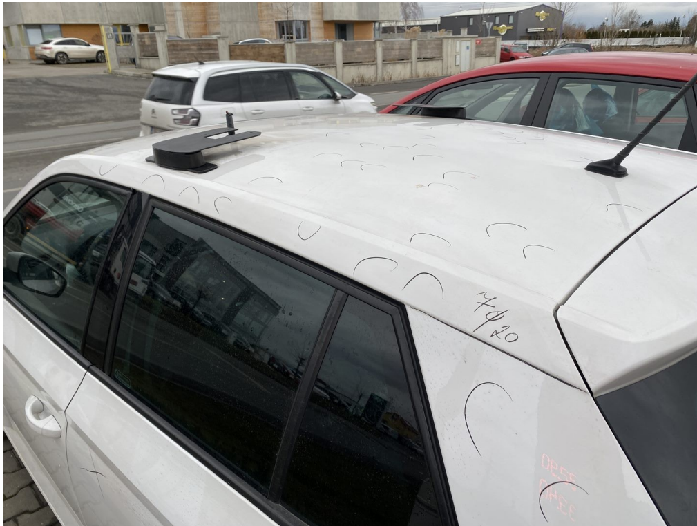
Viz popis k poškození č. 1