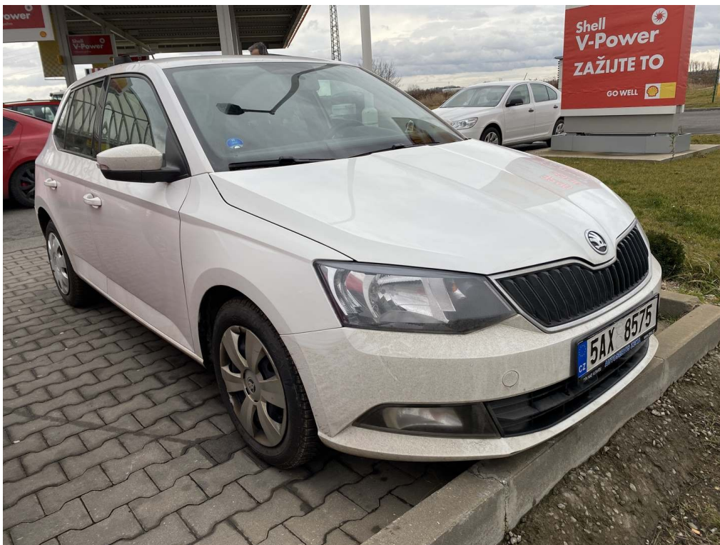
Viz popis k poškození č. 1