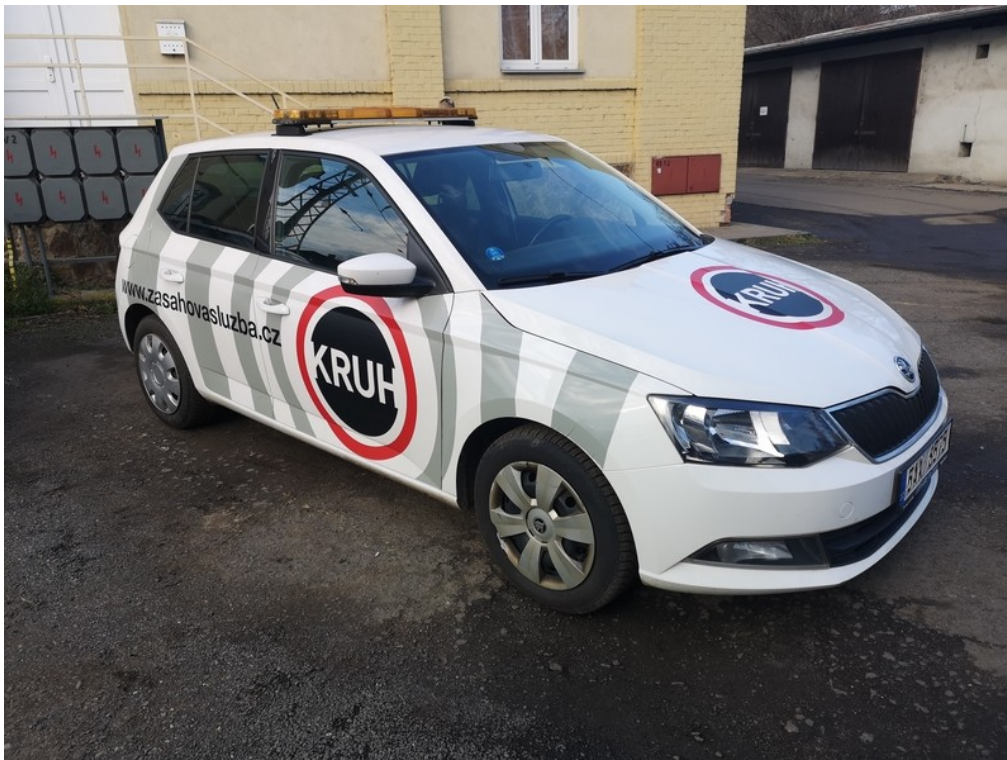
Pohled zepředu zprava